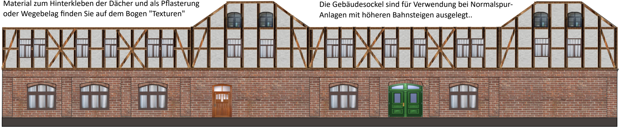
Anbau Fracht außen

Die Gebäudesockel sind für Verwendung bei Normalspur-Anlagen mit höheren Bahnsteigen ausgelegt..